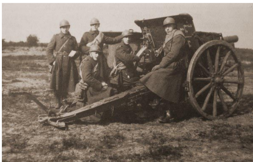
Foto van een kanon waarmee het regiment uitgerust was